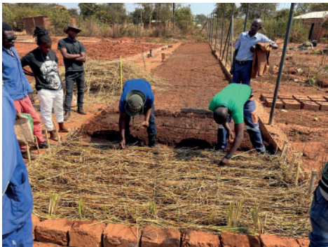
Farm in Kasempa

Seit vielen Jahren liegen uns die Mädchen und jungen Frauen am Herzen. Viele von ihnen sind orientierungslos und wachsen scheinbar chancenlos auf. Als wir im April nach Sambia zurück kamen, wohnten wir für einige Tage bei Freunden. In der Nebenwohnung war eine Frau, die in ihrem Projekt Mädchen und junge Frauen mit einem besonderen Schulungsprogramm unterrichtet. Da haben wir gleich Feuer gefangen und auch