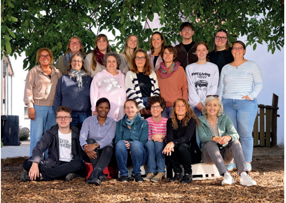
Teamfoto Kindergartenjahr 2025/2026

September 2025