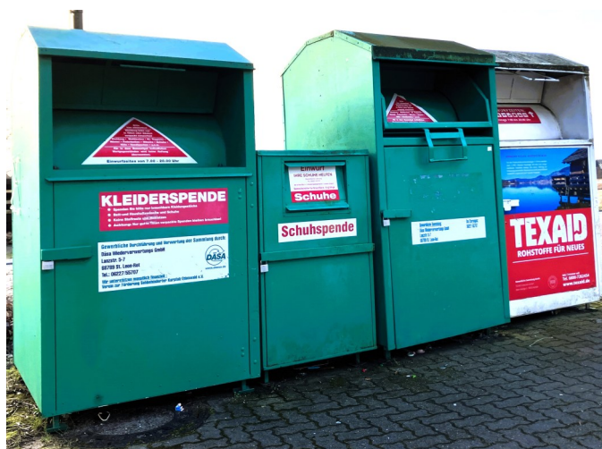
Altkleidercontainer in Friedrichstal (beim Hebewerk, Ausfahrt Wallonenstr.)

Das Statistische Bundesamt informiert, dass im Jahr 2023 rund 175.000 Tonnen Textil- und Bekleidungsabfälle von privaten Haushalten eingesammelt wurden, was etwa 2 kg pro Kopf entspricht. Die Verbraucherzentrale in Nordrhein-Westfalen geht davon aus, dass etwa 90% der auf diese Weise gesammelten Altkleider und Textilien wiederverwendet oder recycelt werden.